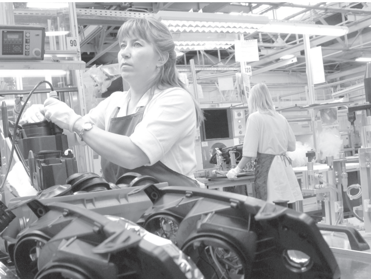
В рамках диверсификации экономики моногорода в промышленном парке ДААЗ появятся три новых резидента. Клинская мебельная фабрика создаст для димитровградцев 800 новых рабочих мест, ГК «БКС» - 200, компания «Магеллан» - 500.